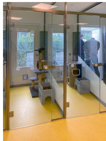
← ...en bij KMDA in Antwerpen (Koninklijke Maatschappij voor Dierenbescherming Antwerpen)

Voor veel pensionhouders is dit 'kat in het bakkie' en beschikt het pension al over solitaire huisvesting of zijn hier al plannen voor gemaakt, voor andere zijn de voordelen van dit type huisvesting nog wat minder bekend en helpt dit artikel wellicht om nog eens na te denken over hoe de katten gehuisvest kunnen worden in de toekomst.