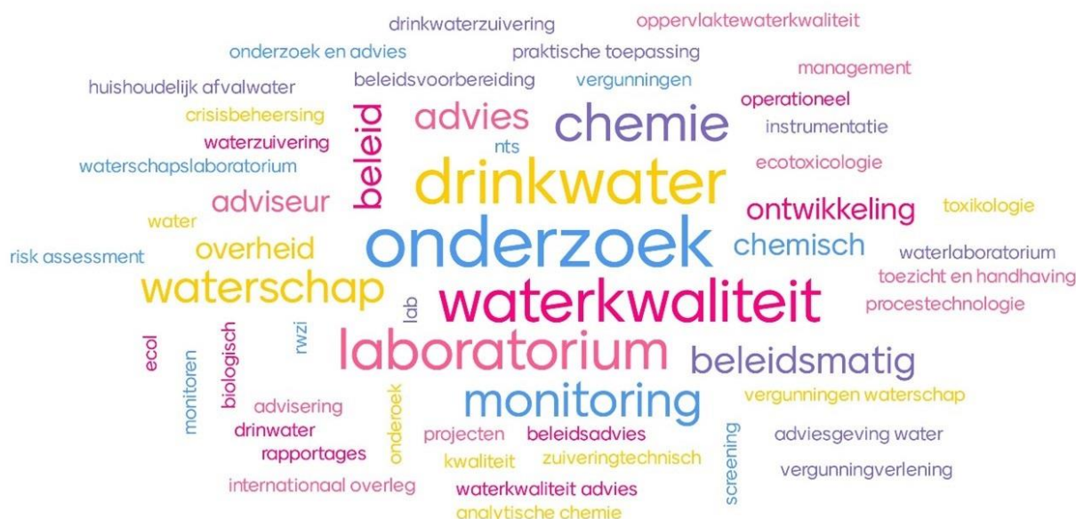
Afbeelding 3. Wordenwolk als antwoord op de vraag ‘in welk werkveld bent u actief?’. Vaker ingevoerde begrippen zijn hier groter afgebeeld. Deze afbeelding is verkregen met de software Mentimeter