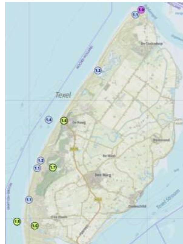
Figuur 4: Kaart van Texel met daarop de beoogde locaties van de verschillende projecten (1.1 t/m 1.9)

Rijkswaterstaat, Staatsbosbeheer, Ministerie van Defensie en Provincie Noord-Holland een stap in het dichterbij brengen van de doelen uit de visie. In deze periode van vijf jaar worden negen projecten uitgevoerd. Dit gaat zowel om concrete inrichtingsmaatregelen (hoofdstuk 1) als studies naar knelpunten (hoofdstuk 2). Studies dragen bij aan nieuwe inzichten en/of aan kansrijke projecten die weer een plaats krijgen in de komende Meerjarenprogramma's. Zo blijven wij werken aan het dichterbij brengen van het visiebeeld Noordzeekust 2050.