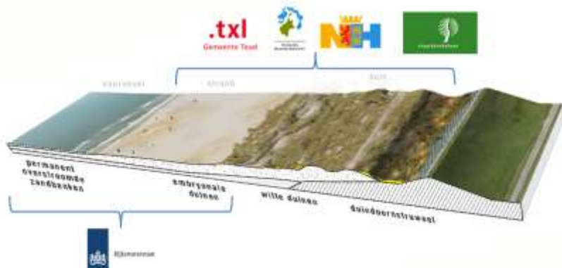
Figuur 1. Gebied waarin de verschillende partijen verantwoordelijkheid hebben.

In Fout! Verwijzingsbron niet gevonden. is opgenomen in welk deel van de kustzone elk van deze partijen werkzaam is.