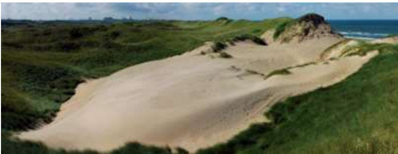
Figuur 3. Voorbeeld van een kerf waar zand de duinen in waait waardoor deze hoger worden ("Het gat van Heemskerk").

Het doel is om de Texelse duinen te laten meegroeien met de zeespiegelstijging. Duinen kunnen in potentie met de zeespiegel meegroeien als zandverstuiving van strand naar de duinen en in de duinen mogelijk is. Dit vraagt om het dynamiseren van de duinen ten opzichte van de huidige situatie. De vijf partijen willen hiervoor een aantal stuifkuilen en kerven aanleggen. Een kerf is hierbij gedefinieerd als een diepe stuifkuil die zand doorgeeft van het strand naar de achterliggende duinen, of binnen het duingebied ( Fout! Verwijzingsbron niet gevonden. ). De kerven zijn niet zo diep dat sprake is van instromend water vanuit zee. Het is raadzaam om afspraken te maken tot hoe diep kerven 'mogen' uitstuiven (grenswaarde). Dat kan verschillen per locatie. Ook is het raadzaam de kerven gefaseerd aan te leggen. Waar, hoe diep en hoeveel stuifkuilen/kerven worden aangelegd zal worden opgenomen in een uitvoeringsprogramma, dat volgt op deze visie.