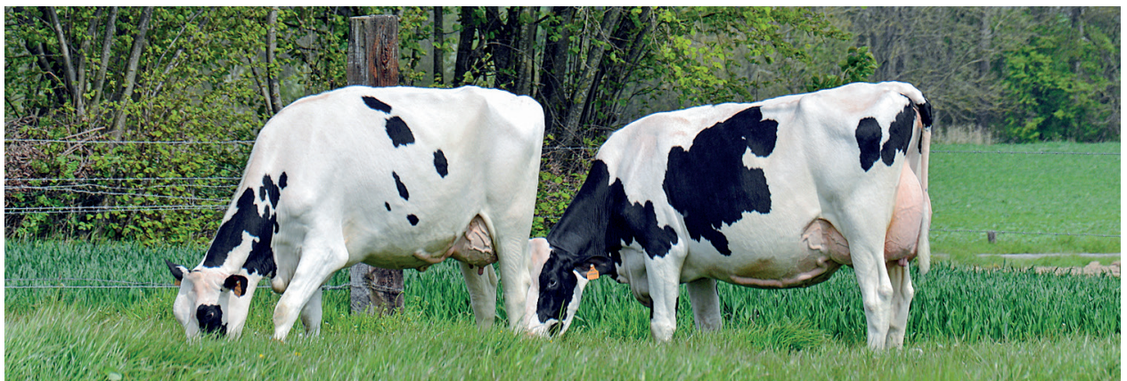
Dochters van Peak Hotline bij Herman d'Hauwe in Sint Lievens-Houtem

Ongeveer een kwart van de stieren in het Noord-Amerikaanse aanbod van CRV is afkomstig uit het Peak-programma waarvan CRV in de Verenigde Staten een van de partners is. 'De basis van het Peak-programma is de aankoop van jonge vrouwelijke dieren met hoge genoomfokwaarden', vertelt Van Burgsteden. 'Deze potentiële stiermoeders worden intensief benut als donoren, wat jaarlijks resulteert in vele duizenden embryo's die worden ingezet op de Peak-ontvangstbedrijven. Van