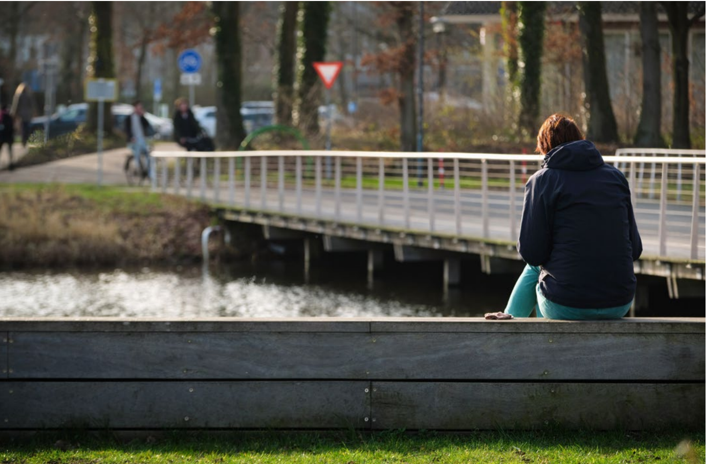
'Sommige studenten zagen er zelfs tegenop om naar de campus te gaan.'