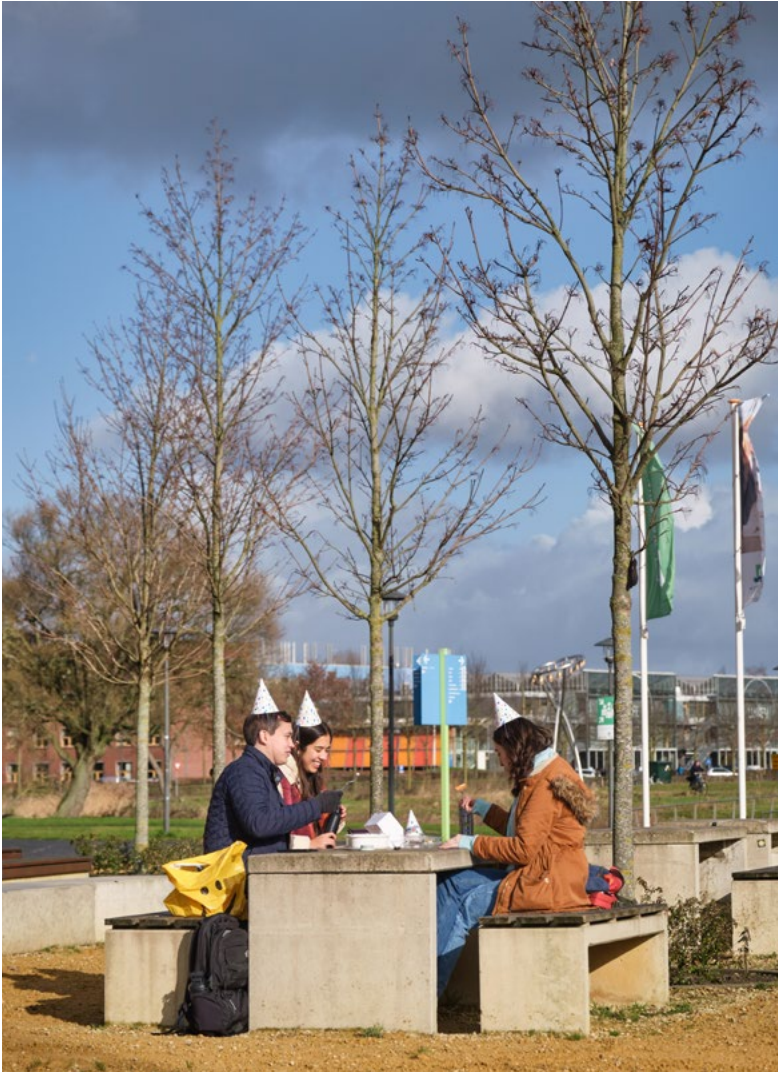
'De leuke dingen om studeren heen, zoals met vrienden afspreken, waren lang een soort van illegaal.'

studenten onderling. Docenten worstelen daar mee, vertelt Hartman. 'Wageningen staat toch bekend om dat kleinschalige, dat persoonlijke contact. De kwaliteit van het onderwijs hangt daar ook mee samen. Docenten willen hun studenten bereiken, maar hoe doe je dat online? Of studenten het verhaal kunnen volgen, moeten ze aflezen aan de enkeling die zich actief mengt in de online colleges.'