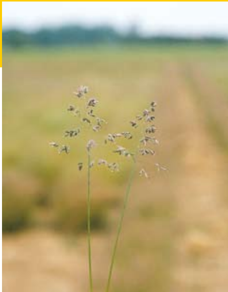
De bloeiwijze van veldbeemd

door een tweede werkgang. Daarbij leggen we hetzelfde sportveldmengsel op circa 1 cm weg. Als resultaat zullen we een hoger aandeel veldbeemd terugvinden in de grasmat. Naast deze andere werkwijze bij het door- of inzaaien zou theoretisch ook het gebruik van veldbeemdzaad met een hoger duizendkorrelgewicht tot een positief resultaat moeten leiden. Hogere koolhydraatreserves in het graszaad maken het veldbeemd immers vitaler en geven mogelijk net dat zetje dat nodig is voor een vlotte vestiging. Akkerbouwers passen deze methode bij het zaaien van tarwe met een hoger duizendkorrelgewicht inmiddels al met succes toe.