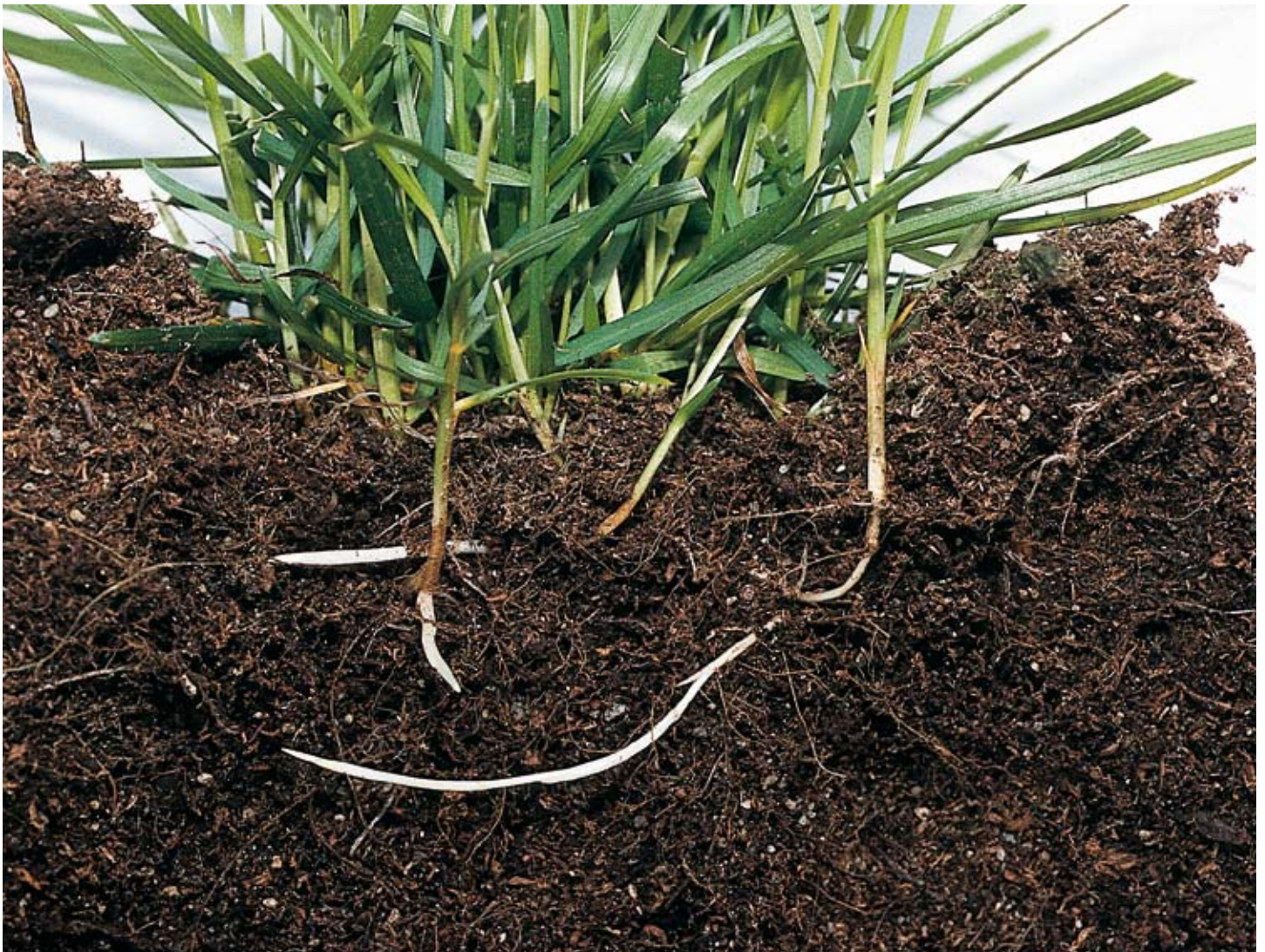
Veldbeemdgras is een stolonenvormer, die de zode stevigheid geeft.

Ook de eerder genoemde Limousine, Markus en Orfeo treffen we hier aan, waarbij Limousine en Markus uitblinken in standvastigheid; Markus in resistentie tegen bruine vlekkenroest en Orfeo in resistentie tegen bladvlekkenziekte. Limousine, tenslotte, kreeg van deze rassen de hoogste waardering voor fijnbladigheid. Euro Grass heeft hoge verwachtingen van het nieuwe ras Joker en hoopt daarmee aan de top te komen in de Grasgids.