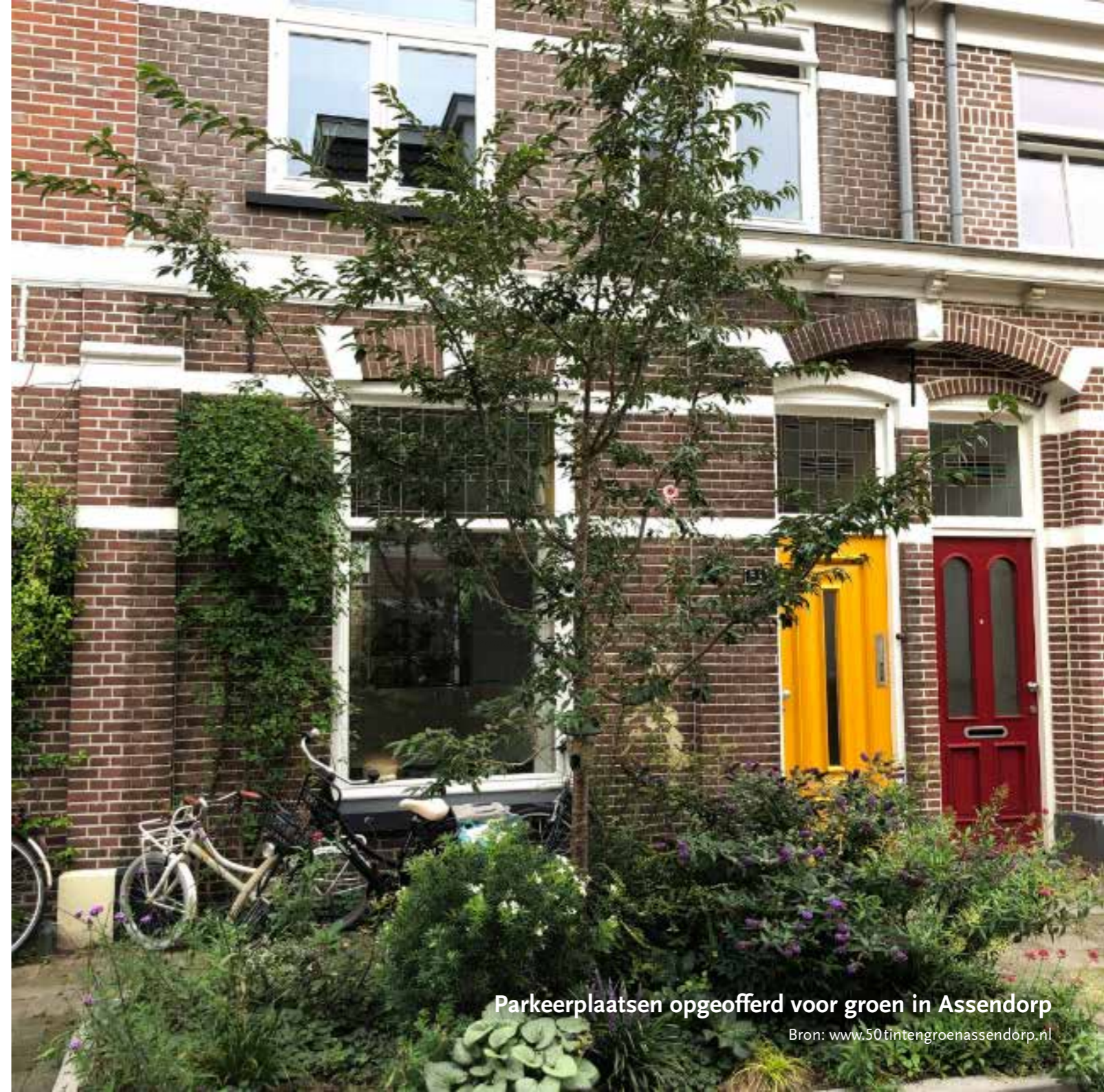
Parkeerplaatsen opgeofferd voor groen in Assendorp

De veerkracht in dit voorbeeld groeit bij elke nieuwe ontwikkeling. Men leert en raakt steeds meer betrokken. Eind 2020 waren er bijvoorbeeld 25 huizen beter geïsoleerd, 20 daken voorzien van zonnepanelen en was er 2 hectare groen dak aangelegd voor 877 huishoudens. Daar is behalve veel tijd ook veel geld geïnvesteerd. Het uitwisselen van informatie over energiebesparing en duurzaamheid is onderdeel geworden van het dagelijks leven in de wijk. Het aanpakken van veel verschillende projecten en onderwerpen lijkt in Assendorp goed te werken. De projecten voor groen, klimaatadaptatie en gezondheid versterken elkaar. Er is een duidelijke samenhang tussen de groenere straten en daken en de projecten die om waterberging draaien. De communicatie wordt creatief aangepakt. Niet alleen middels infoavonden en een buurtkrant, maar ook met een housewarmingspel (huiskamergesprek). Creatief is ook het genoemde experiment met de tijdelijke leefstraat.