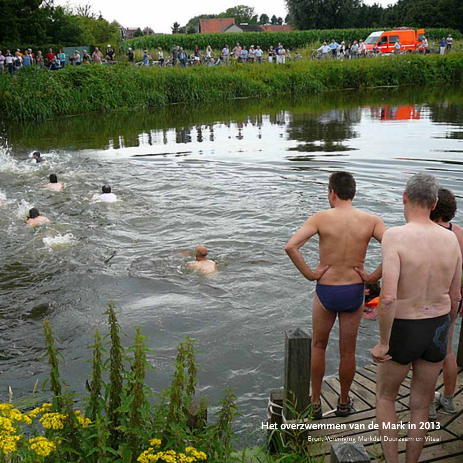
Het overzwemmen van de Mark in 2013