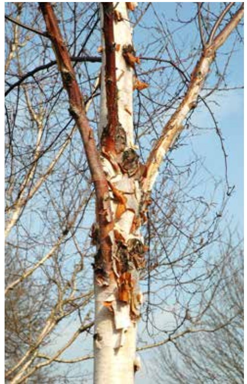
Betula albosinensis heet voortaan Betula utilis subsp. albosinensis