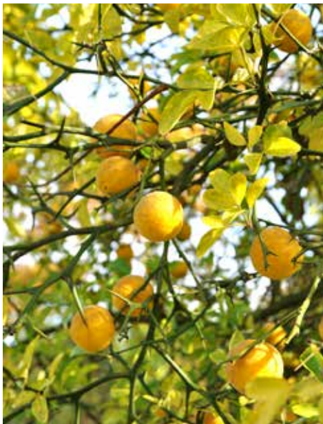
Poncirus trifoliata gaat Citrus trifoliata heten

De European Nurserystock Association (ENA) houdt toezicht op de Naamlijst houtige gewassen . De Naamlijst vaste planten staat onder toezicht van de Internationale Stauden Union (ISU). Daarmee zijn de namenlijsten in de boomkwekerijsector internationaal leidend voor het bepalen van de juiste schrijfwijze en leidend voor de voorkeursnamen van loofhout, coniferen, fruit en vaste planten. Door de samenwerking met deze partijen zijn de naamlijsten wetenschappelijk en wettelijk correct en praktisch werkbaar.