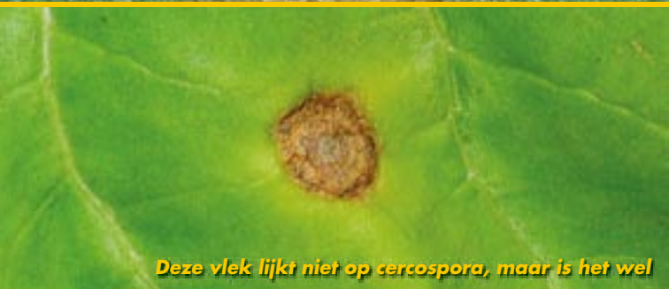
Deze vlek lijkt niet op cercospora, maar is het wel