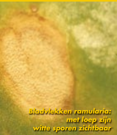
Bladvlekken ramularia: met loep zijn witte sporen zichtbaar