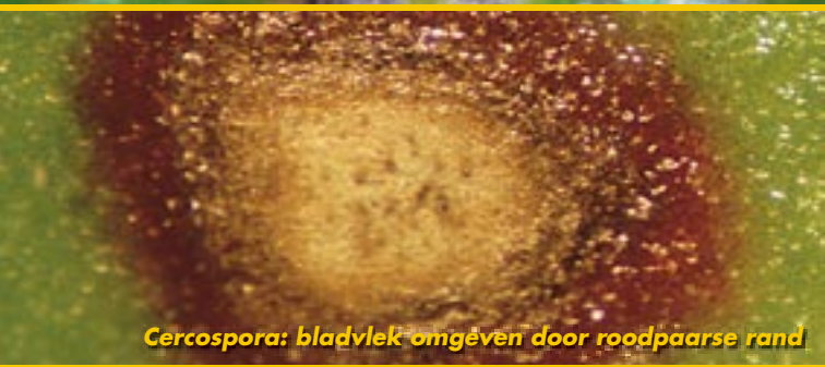
Cercospora: bladvlek omgeven door roodpaarse rand