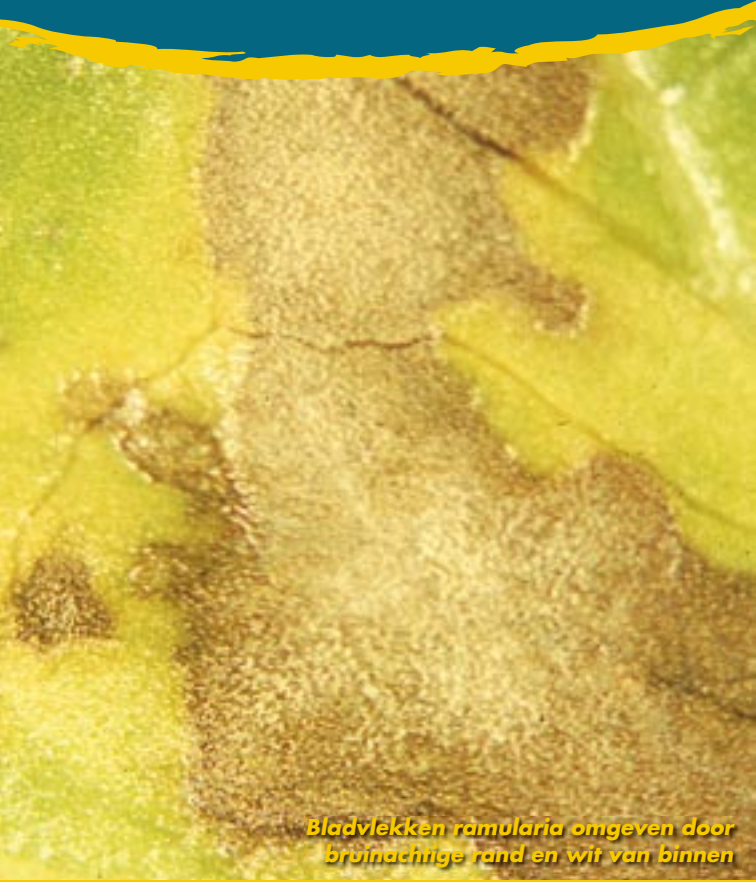
Bladvlekken ramularia omgeven door bruinachtige rand en wit van binnen