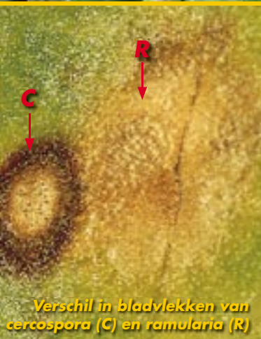
Verskil in bladvlekken van cercospora (C) en ramularia (R)