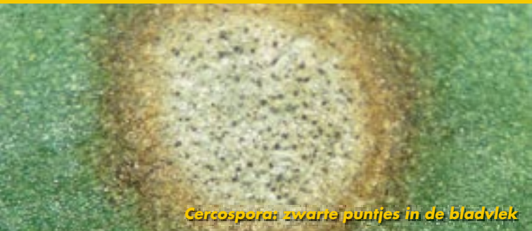
Cercospora: zwarte puntjes in de bladvlek