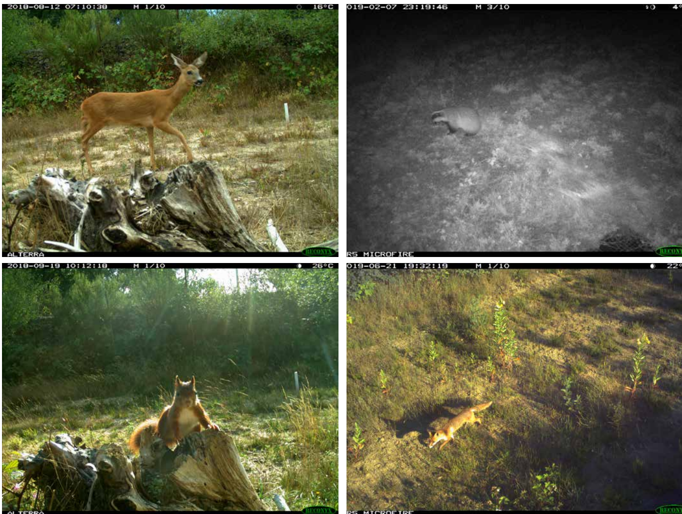
Figuur 4. Camera-beelden van een ree, das, eekhoorn en vos die de natuurbrug passeren.

Dat twee in de omgeving geregistreerde soorten – konijn en egel – tijdens het onderzoek niet op de natuurbrug zijn geregistreerd, betekent niet dat de natuurbrug niet geschikt is voor deze soorten. Tijdens het onderzoek was er geen konijnenburcht aanwezig op korte afstand van de natuurbrug. De afwezigheid van de egel lijkt vooral een gevolg van de zeer lage dichtheden waarin deze