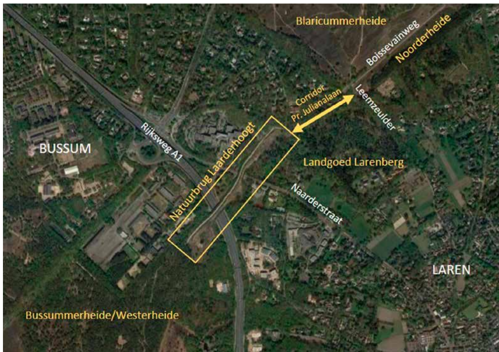
Figuur 1. (boven) Ligging van natuurverbinding Laarderhoogt, inclusief de gelijknamige natuurbrug. Figuur 2. (links) Het ecoduct over de Naarderstraat met heischrale vegetaties, struweel en een stobbenwal.