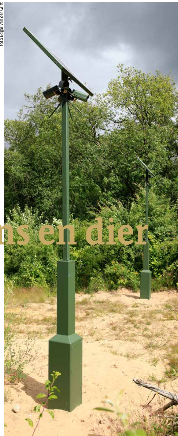
Figuur 3. De cameravallen – van het type Reconyx MicroFire MR5 – op Natuurbrug Laarderhoogt. De camera's zijn schuin naar beneden gericht in een hoek van circa 60 graden. Deze infraroodcamera's hebben een bewegings- en warmtesensor, een reactietijd van 0,1 sec, een maximaal detectiebereik van 12 meter en een flitsbereik (infrarood) van 15 meter.