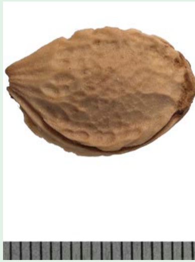
Steen Imperiale Ottomane Freising (Beieren).