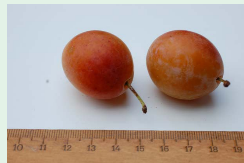
Imperiale Ottomane Freising (Beieren).