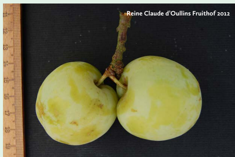
Tabel 1. Afmetingen (mm) van pruimen Imperiale Ottomane en R. Cl. d' Oullins.