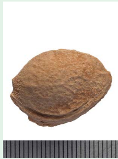
Steen Reine Claude d'Oullins Fruithof.