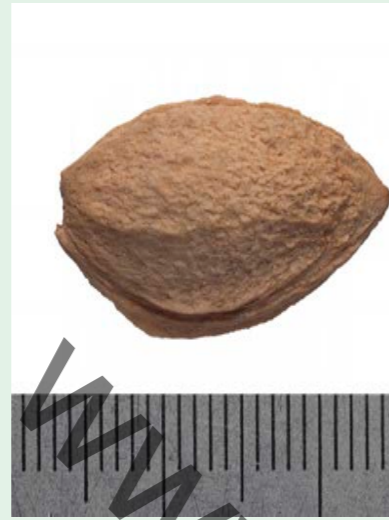
Steen Reine Claude d'Oullins Someren 2018.

De grondkleur is (groen)geel, maar de meeste waren oranje tot soms rood aangelopen. De schil heeft een dun waas en is nogal taai en zurig, wat onder meer ook door Berghuis en Langenthal wordt genoemd. Het geel-oranje vruchtvlees proeft in de mond wat 'spekkig'. De pruimen van Freising komen goed overeen met de afbeelding en beschrijving van Berghuis.