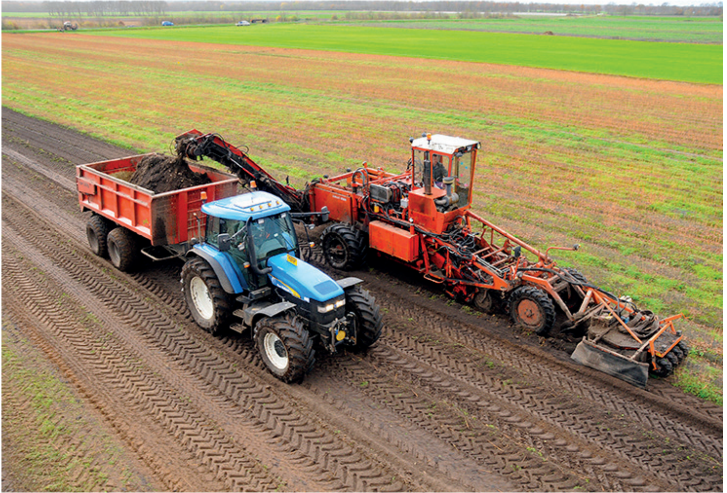
Voor 1 oktober moet het land leeg zijn, om vervolgens binnen een maand een vanggewas te zaaien. Dat maakt de teelt van zomerbloeiërs onmogelijk.

2023. Deze maatregel wordt namelijk geleidelijk ingevoerd tussen 2023 en 2027. Vanaf 2027 is een rustgewas in één of drie verplicht en vanggewassen op het hele areaal zand- en lössgronden na de hoofdteelt. Veebedrijven moeten dan minimaal op 70 procent rustgewassen telen, waarvan de helft blijvend (langer dan vijf jaar) grasland is. De bedoeling van deze maatregel is een verbetering van de waterkwaliteit en de biodiversiteit en het moet leiden tot een klimaatbestendige landbouw.