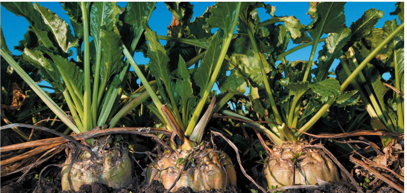
Afb. | 1