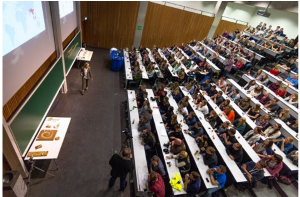
‘Tijdens mijn studie ben ik colleges gaan geven, eerst over de koningscobra en daarna over reptile superheroes . Daar kwam landelijke media-aandacht voor en toen is het balletje gaan rollen.’

Ik kijk in dat verband naar de invloed van waterstructuren in Spanje op padden. Een van de ideeën die ik daarover