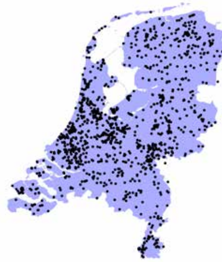
Figuur 1: Verspreidingskaart van alle doorgegeven waarnemingen van vangsten door huiskatten.

Door ook gebruik te maken van de vangsten van de huiskat krijg je een veel completer beeld van de verspreiding en aantallen, vooral in stedelijk en Randstedelijk gebied. Plaatsen waar de uil en de onderzoeker niet zo snel komen.