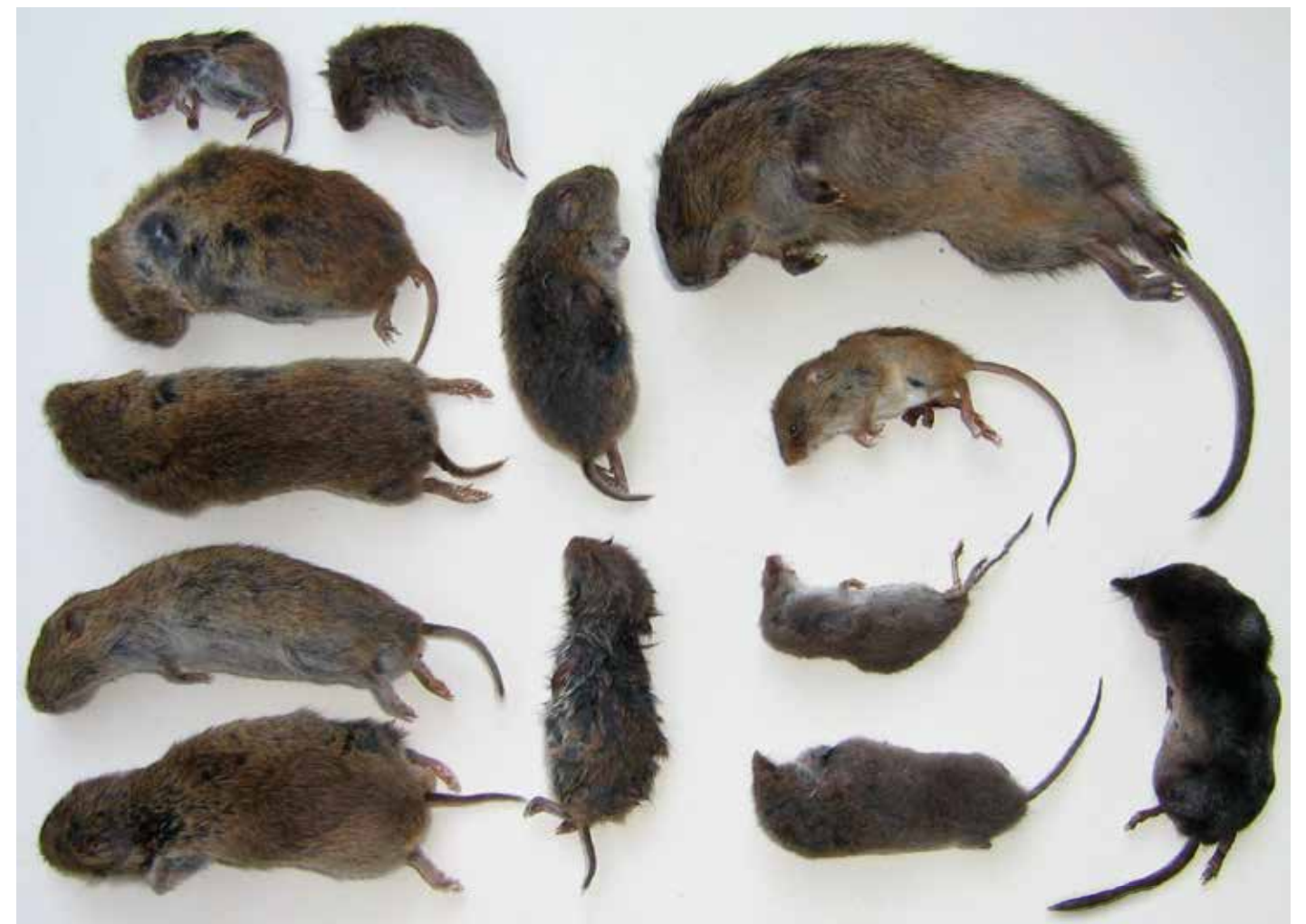
Een kleine selectie van ingestuurde muizenvangsten.

Een oproep in 2014 van Vroege Vogels Radio heeft het al eerder opgezette onderzoek een enorme boost gegeven. In de inmiddels twee jaar dat het project loopt zijn er al duizenden muizen (en andere dieren) gemeld. Dit gebeurt via de website waarneming.nl. Hierop kunnen mensen een foto plaatsen van de door hun kat