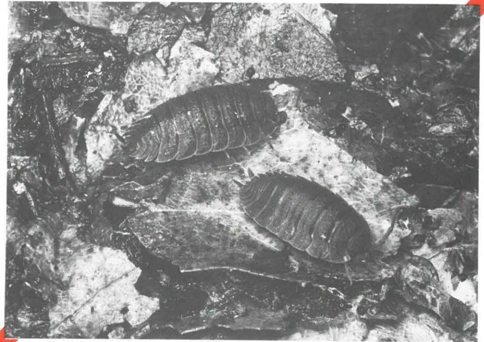
"pissebedden ( Oniscoidea ), foto Rijksinstituut voor Natuurbeheer - Arnhem"

Overlast door steekmuggen is vaak te wijten aan water onder de vloer, dus kijk ik na een half jaar (zie tip één), eerst maar weer eens in de eigen kruipruimte. Deze is op de doorgang onder de funde-