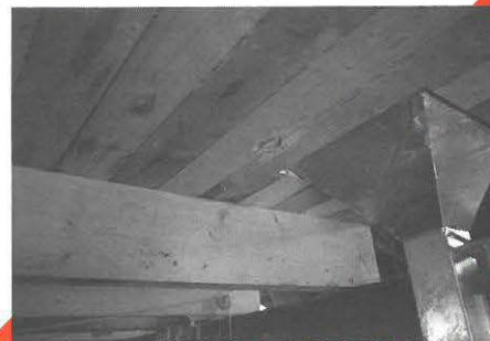
Bruine rat-schade. Geknaagd gat in zolder (= silobodem) vloer; van onder uit.

Omdat nieuwe leidingen naar de voerbakken van de koeien in de melkstal moesten worden aangelegd, werden het plafond van de melkstal en de isolatieplaten weggehaald. Toen bleek pas dat de