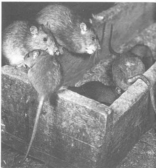
ratten doen zich tegood aan voedselvoorraden

Reeds in 1941 voorzag de toenmalige Technische Afdeling van de organisatie T.N.O. de mogelijkheid van een grote rattenplaag in Nederland ten gevolge van de oorlogsomstandigheden. Door