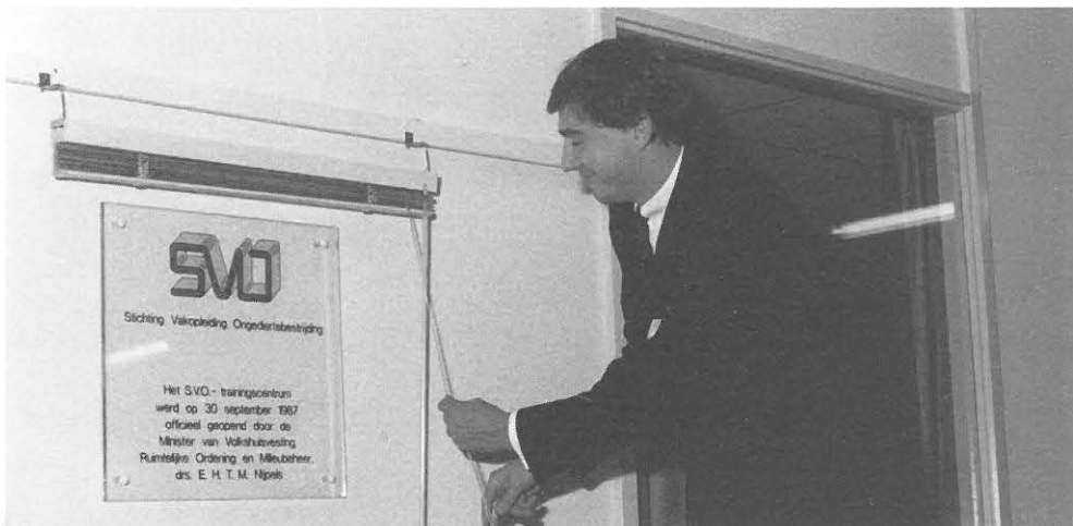
minister Nijpels opent het nieuwe trainingscentrum van de Stichting Vakopleiding Ongediertebestrijding