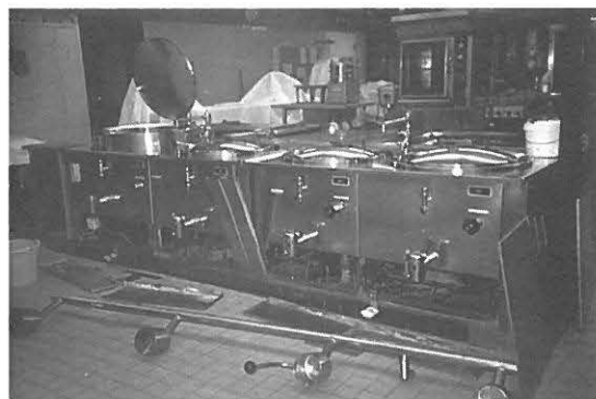
schuilplaatsen toegankelijk maken