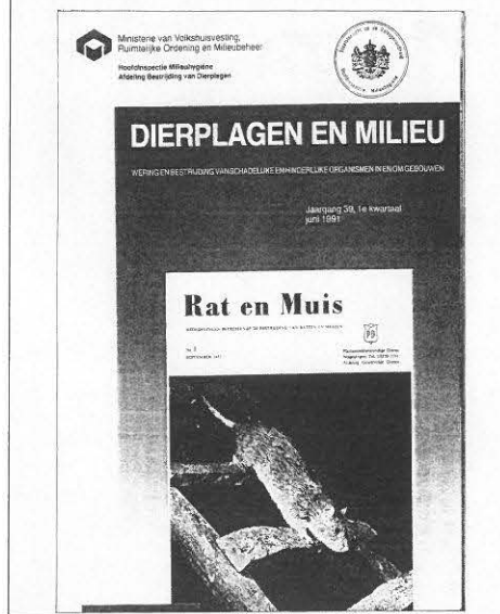
metamorfose in de maak