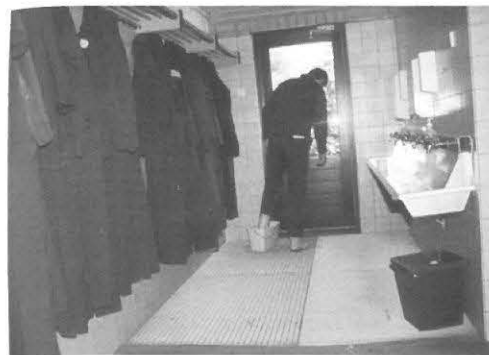
persoonlijke hygiëne speelt een belangrijke rol

Behoudens het verplichte gebruik van persoonlijke beschermingsmiddelen moet men ook