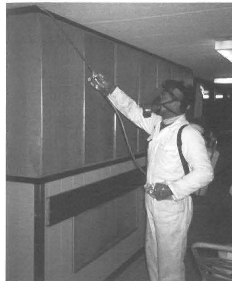
beschermende kleding en adembescherming tijdens de spuitactie

tijdens de opslag en het vervoer van bestrijdingsmiddelen maatregelen nemen om ongelukken te voorkomen. Behalve gebruik van werkkleding en adembescherming speelt ook persoonlijke hygiëne een belangrijke rol.