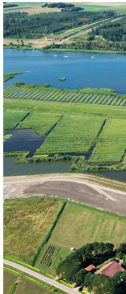
Rietmoeras in de IJsseldelta

Het OBN-onderzoek bestaat uit een omvangrijke literatuurstudie en een analyse van 12 verschillende moerasgebieden, verspreid over het land. De onder-