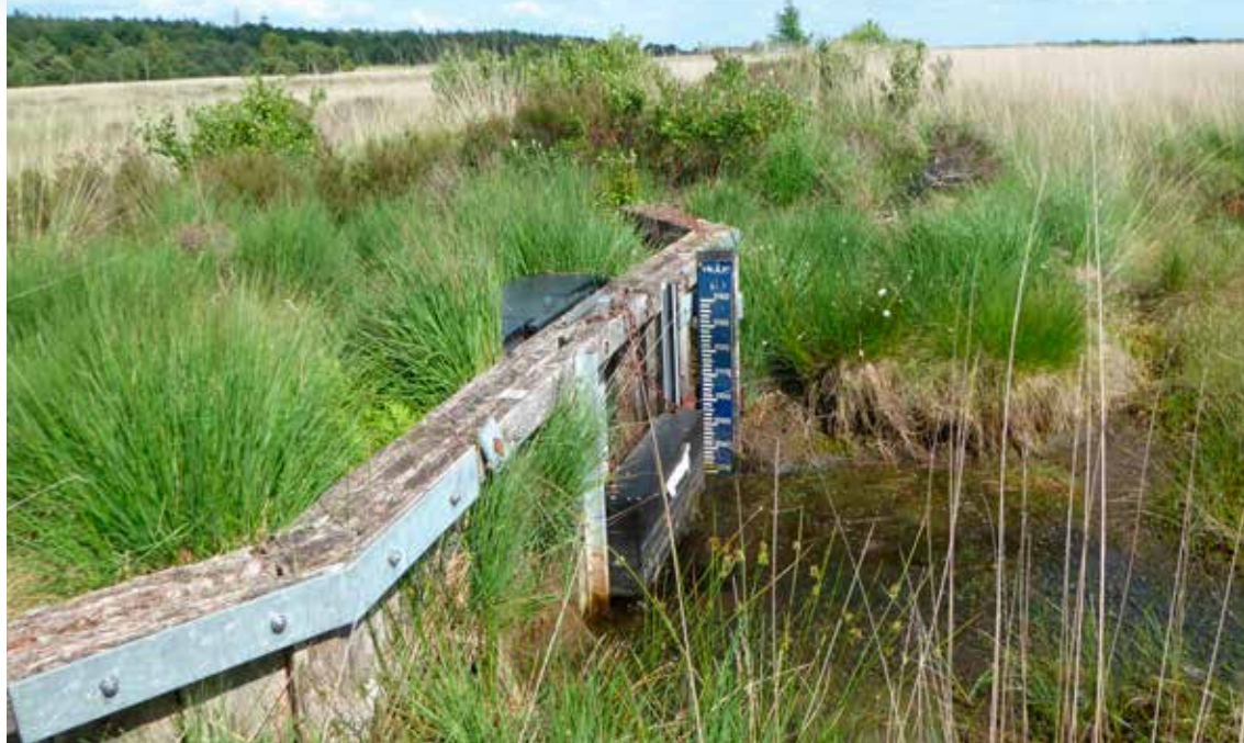
Uitgezakt waterpeil in de droge zomer van 2020 in het Fochteloërveen.