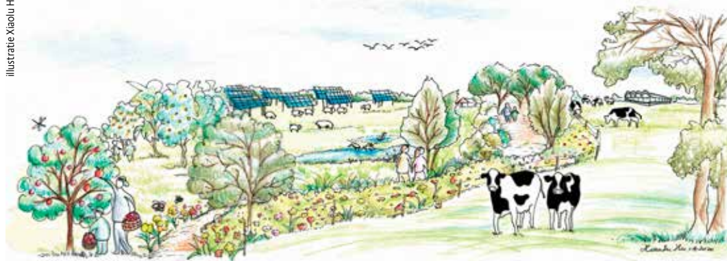
Figuur 1. Visualisatie overgangszone (WUR en PBL, 2020)