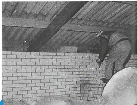
lokaas door bestrijder zelf uit te leggen en te controleren