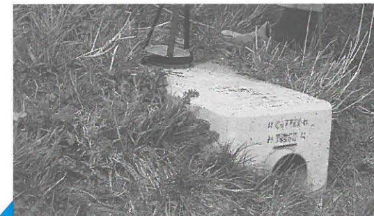
afsluiten vandalismebestendige voerplaats