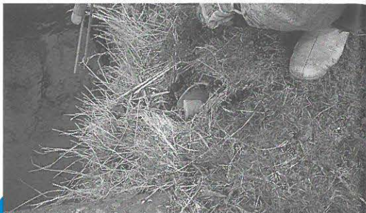
plaatsing vetbol in voerpijp