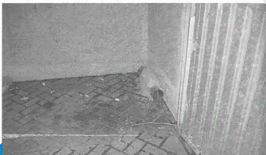
voerplaats in containerblok

Er is een aantal punten dat belangrijk is voor de keuze en de inrichting van een voerplaats: