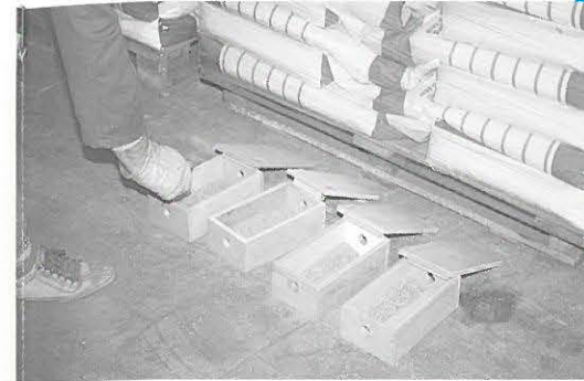
voerkistjes van lokaas voorzien

Ter plaatse werd mij al snel duidelijk dat het niet ging om een alledaags probleem; een omvangrijke populatie huismuizen werd aangetroffen in een 3-tal diep-pitstallen elk met een vloeroppervlak van 3750 m 2 en in aanpalende sorteerruimten. De binnenwanden van de afzonderlijke stallen waren met Dupanel-plates geïsoleerd en boden een ideale nestelgelegenheid aan de huismuizen. Met alle respect voor de goede bedoelingen van de pluimveehouder moest worden vastgesteld dat de getroffen bestrijdingsmaatregelen volslagen ontoereikend waren. Uit het gesprek werd mij al snel duidelijk dat alle in de handel verkrijgbare lokazen waren beproefd en de te verwachten vraag werd dan ook gesteld: "Wat is het beste middel om muizen te bestrijden?". Het antwoord was dat vrijwel alle rodenticiden toegelaten voor de bestrijding van huismuizen afdoende zijn als er op de juiste plaatsen voldoende voerplaatsen zijn ingericht en er tevens doelmatige controle en verversing van het in voerkisten uitgezette lokaas plaatsvindt.