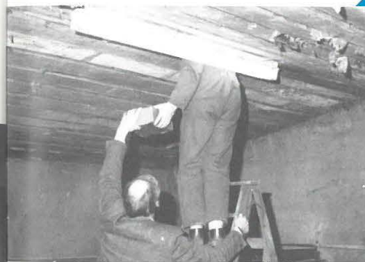
"voerdoos bij de muizen brengen"

Toch komt het in de praktijk geregeld voor dat niet aan de bovengestelde regels wordt voldaan. Vooral bij de toepassing in voerkisten e.d. schort het nogal eens aan een goede uitvoering, ook wat betreft lokazen met als werkzame stoffen bromadiolon, chloorfacinon en warfarin. Dat niet elke dienst of bedrijf in staat of bereid is (time is money) zelf een groot aantal kistjes te timmeren, is te begrijpen. Met de opdrachtgever voor de uitvoering van de bestrijding kan worden overeengekomen wie voor de benodigde voerkistjes zorgdraagt. Pas als deze er zijn, moet men beginnen met de bestrijding. De kans is aanwezig dat betrokkenen dat niet direct doen, zodat er veel tijd verloren