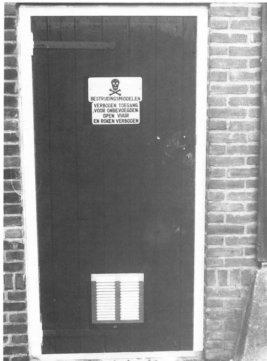
Afbeelding 4. Op de buitenzijde van de bewaarplaats dient een duidelijk leesbaar opschrift te zijn aangebracht met de afbeelding van een doodshoofd van tenminste 60 mm hoog en het woord „Bestrijdingsmiddelen”, alsmede, indien de bewaarplaats betreedbaar is, een opschrift: „verboden toegang voor onbevoegden, open vuur en roken verboden”.

Om tegen dit risico beschermd te zijn, dienen waar nodig persoonlijke beschermingsmiddelen te worden gedragen. Als (doelmatige kleding) wordt aangemerkt een volledig regenpak (of een goed sluitende overall) dus met capuchon. Het jasje van het regenpak