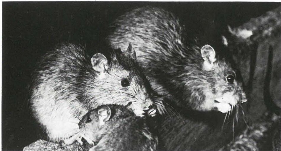
Bruine ratten ( Rattus norvegicus Berk.) in voerbak.