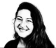
Tekst Marieke Enter

bemonstering of vismigratieprojecten.’ Dat gaat dan om de ‘kleinere’ meervallen. Want de grote exemplaren worden weliswaar vaker gezien dan vroeger, maar blijven iets bijzonders. Neitzel heeft wel een verklaring waarom de vissoort de laatste tijd zo floreert dat record na record wordt verbroken: het warmer worden van de Nederlandse wateren. Dat is gunstig voor de voortplanting – meervallen paaien pas