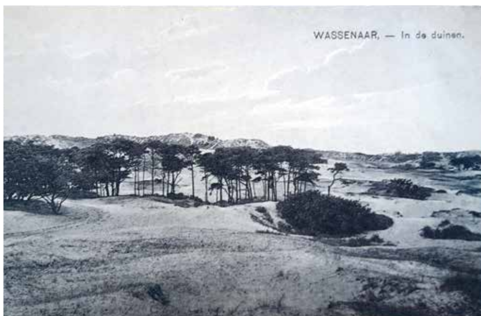
Figuur 5. Kale Wassenaarse duinen achter Groot Hazebroek (ca. 1910).

In dezelfde periode als Duttendel ontstonden er vele landbouwontginningen ter weerszijde van het Wassenaarse Slag, een weg die sinds het begin van de 19 e eeuw op kaarten staat. Van deze landjes zijn wel vele namen