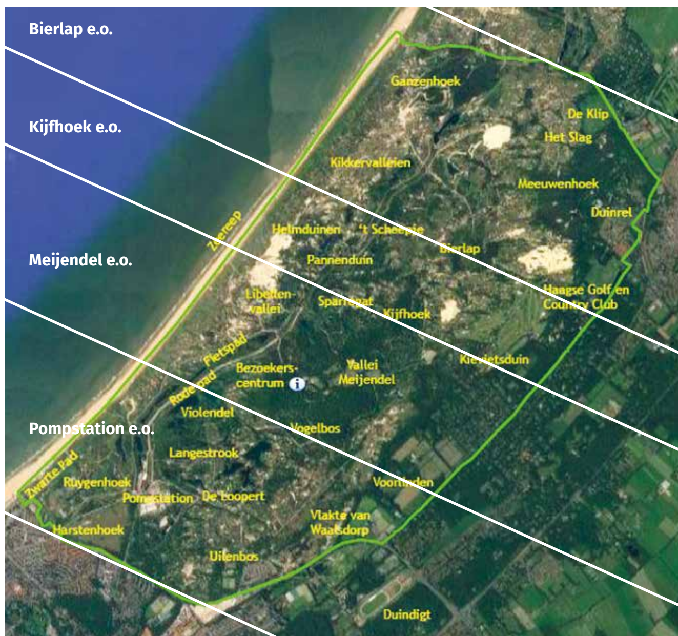
Figuur 7. Vier deelgebieden in het beheergebied Meijndel. Kaart Dunea.

van Duinrell, de voorbode van de aanplant door Staatsbosbeheer in de hele Nederlandse duinstrook. Voor vele plaatsen in het duin wordt aanplant vermeld van els (als windvang), abeel, den, populier, berberis, vogelkers, en lariks. In 1925 waren de duingronden rond Meijndel na onteigening door Van Pallandt verkocht aan de gemeente De Haag die de waterwinning veilig wilde stellen.