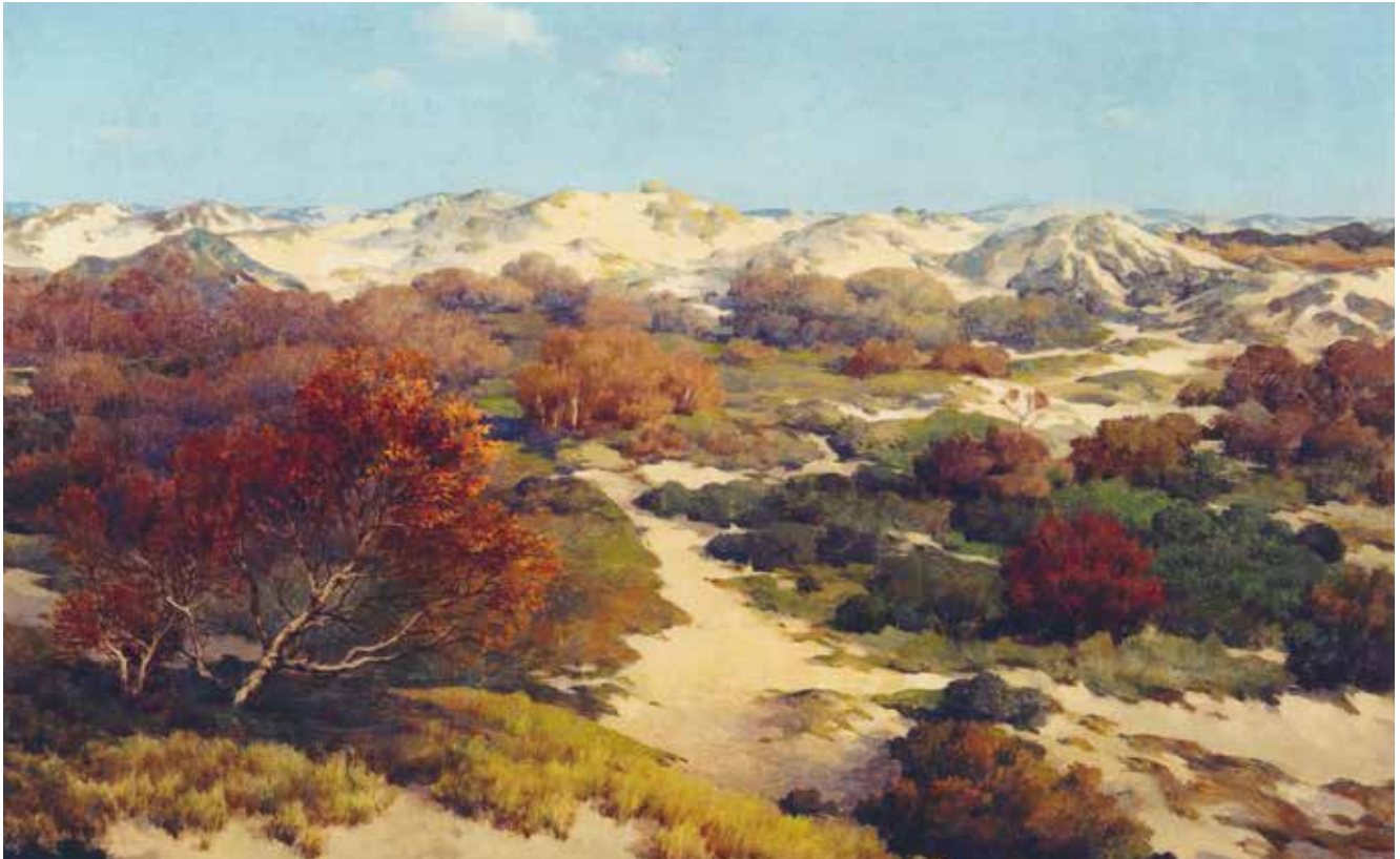
Figuur 6. Olieverfschilderij 'Duinlandschap' door Jan Voerman Jr. (1935). Voerman Museum Hattem. De kunstenaar stond vermoedelijk op De Loopert naast de Waalsdorpervlakte en schilderde in noordelijke richting het duincomplex Prinsenberg en rechts daarvan de Meijendelseberg.

bewaard. Voor het duingebied Berkheide ten noorden van het Wassenaarse Slag werden totaal 115 veldnamen gevonden (Van der Meer 2002). Ruim een derde van die namen eindigde op – del. Ook ten zuiden van de Wassenaarse Slag kwamen er vele ‘teellandjes’, waarvan de namen nog aan de orde komen. De perceeltjes werden uitgegraven om dicht bij het grondwater te komen. Als bemesting gebruikte men ‘grom’ (visafval) en stalmest dat in karren werd aangevoerd. Naast aardappelen werden er rogge en erwten verbouwd, maar vaak mislukte de oogst door droogte of te veel regen. Ook moesten de landjes door uitputting soms jaren braak liggen.