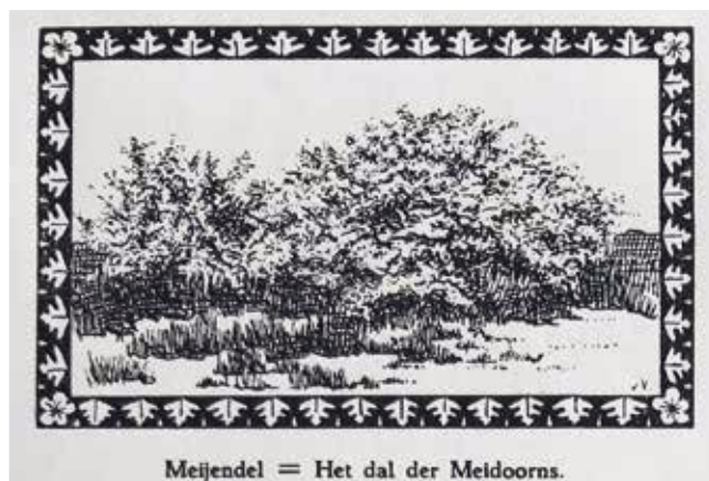
Figuur 2. Tekening Meijendel door J.Y. van Vliet. In: Onze duinen (AVN 1938).

Meyendel (Fig.1). De valleien staan hier als open plekken tussen de getekende spitse zandhoopjes op de kaart. De Schevelincksepan kan de huidige Harstenhoek zijn. Voor het eerst staan op deze kaart namen eindigend op – del en – pan. Del of dal voor een duinvallei is typisch voor dit deel van Holland. In de veldnaam Meijendel staan meidoorns die er kennelijk groeiden (Fig. 2). De naam voor een ronde duinvallei of duinpan, komt (behalve in West-Vlaanderen) bijna alleen voor in de duinen van Wassenaar (met een enkele uitzondering in Heemskerk en Bergen).