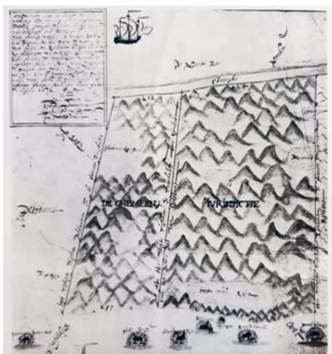
Figuur 1. Kaart van de Gemene Jurisdictie door Floris Jacobs (1602).

Dankzij een grensgeschil tussen Delfland en Rijnland is er een kaart van de 'Gemene Jurisdictie' door Floris Jacobs uit 1602 (Boerboom 1958, 15-17). Het betwiste rechtsgebied van bijna drie kilometer liep van de Schevelincksepan tot