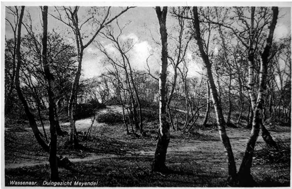
Figuur 4. Berkenbosje in Meijendel (1937). Uitg.-Mij. v/h Weenink & Snel, Baarn.

Duijvels Gat, Hoogh Barent, Kijken Duyn, Kogelenbergh, Muschenbergh, Schutschiete Bergh en Turckenbergh. Alleen de naam Hoogh Barent kwam al eerder voor in de 17 e eeuw. In de naam Muschenbergh schuilt de familie Musch; het was later een bekend uitzicht waar je met 60 trapjes naar boven klom. De drie – berch namen uit de 17 e eeuw en de vijf namen eindigend op – bergh of – duyn in 1712 in de omgeving Waalsdorperpervlakte hebben een tijdelijke functie gehad als uitzichtpunt tijdens militaire manoeuvres. Later komen ze op de oude kaarten niet meer voor. Op de diverse duintoppen waren waarschijnlijk houten schuil-daken gebouwd en platforms voor papieren en kaarten. De sporen van de palen van die bouwsels zijn in de grond teruggevonden.