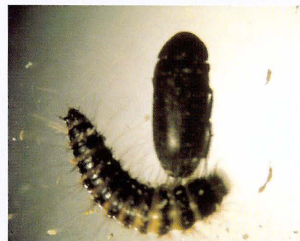
larve + spekkever