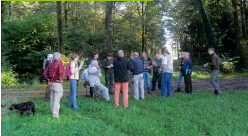
Deelnemers discussiëren in groepen over het rabattenbos