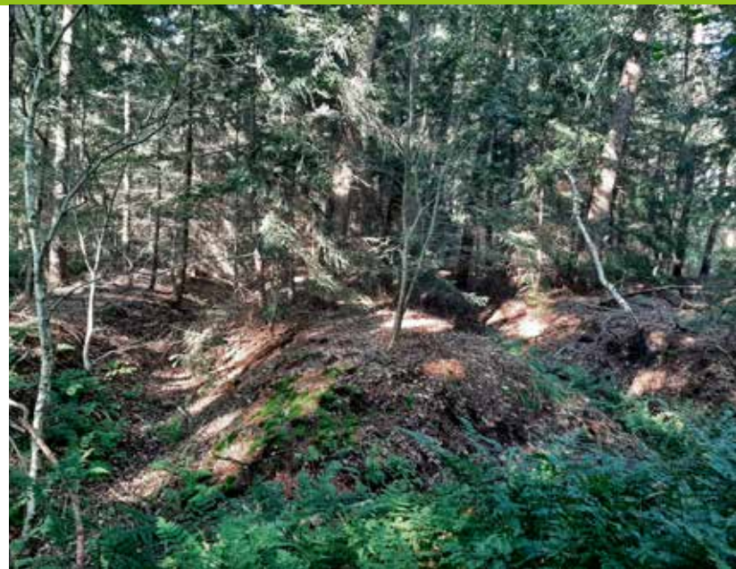
Rabattenbos met naald- en loofboomsorten