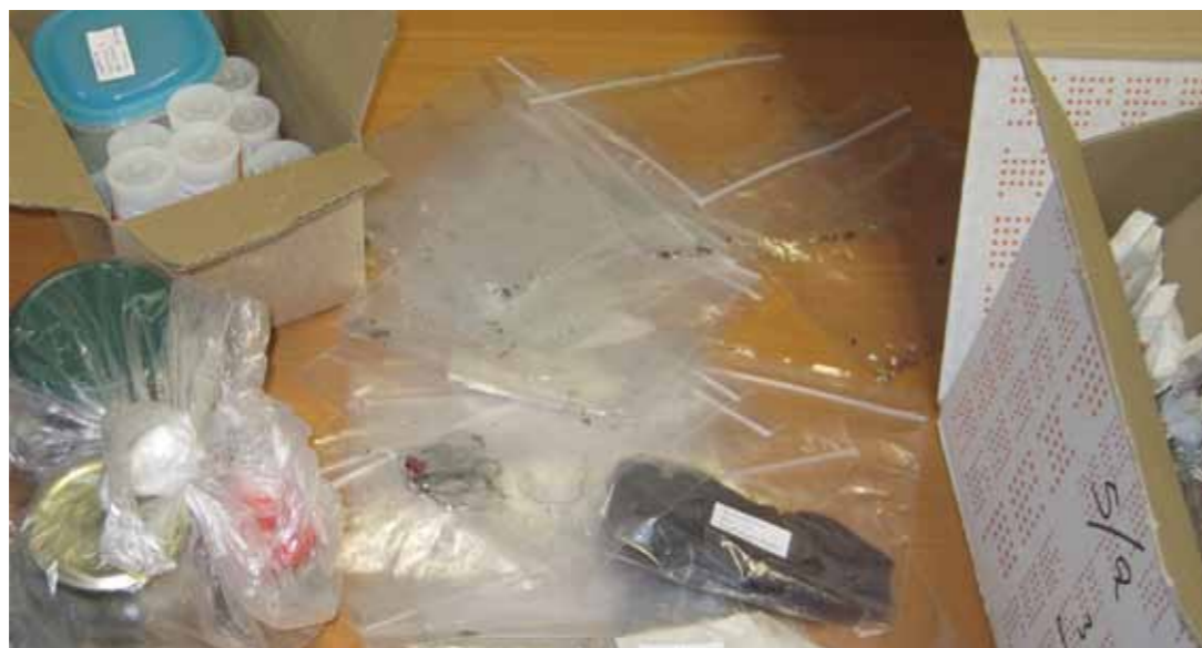
De hoeveelheid monsters die werd opgestuurd door een persoon met 'delusory parasitosis'.

Als geen plaagdieren worden aangetroffen die de klachten kunnen veroorzaken, houdt de rol van een plaagdierbeheerser op. Verwijs de betrokkene met lichamelijke klachten door naar de huisarts. We zijn niet medisch opgeleid en kunnen geen diagnoses stellen aan de hand van de lichamelijke (en psychische) klachten van de betrokkene. Klachten als het gevoel dat beestjes door de huid kruipen en jeuk kunnen door veel factoren veroorzaakt worden, zoals gevoeligheid voor medicatie, drugsgebruik, schimmelinfecties, verschillende ziekten of zwangerschap. Onderzoek het lichaam van betrokkene niet, ook niet als daarom wordt gevraagd. Geef aan dat de huisarts contact met u op kan nemen, zodat aangegeven kan worden dat er geen geleedpotigen zijn aangetroffen en dat er mogelijk sprake is van het fenomeen 'delusory parasitosis'. Het is van belang dat betrokkene bij de juiste instantie terecht komt voor de broodnodige psychische hulp.