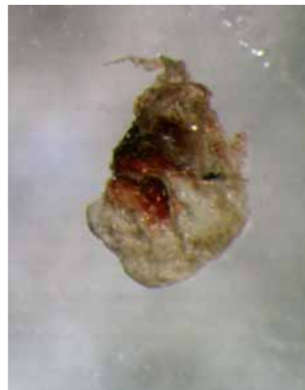
Een bloedkorstje als vermeende parasiet.

Vaak worden de potentiële boosdoeners verzameld met plakband. Deze monsters bestaan dan uit haar, huidschilfertjes en vuil afkomstig van de huid, synthetische vezels, stukjes plantaardig materiaal, stukjes textiel en ander materiaal. Vaak wor-