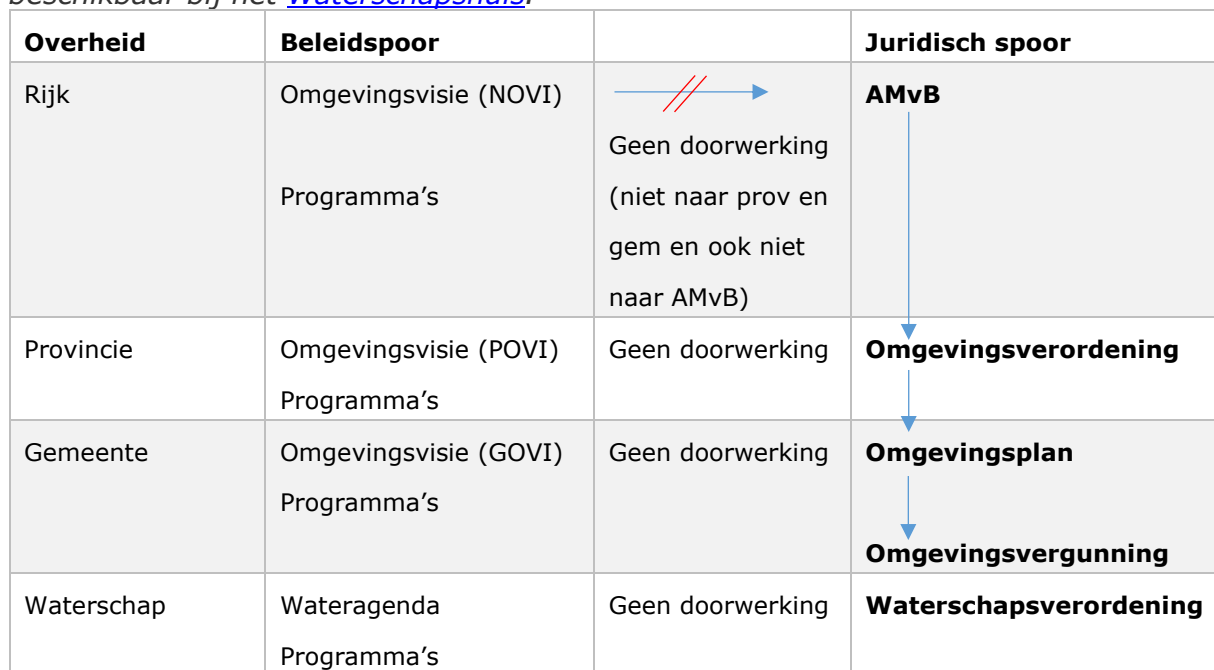
Tabel 5. Relatieschema tussen omgevingsbeleid en juridisch spoor. Meer informatie beschikbaar bij het Waterschapshuis .

Beleid werkt niet automatisch door tot op/in het juridisch spoor en hoger beleid (bijv. een NOVI) werkt ook niet automatisch door naar lager beleid (bijv. een GOVI). Bovendien is er geen rangorde tussen gemeentelijk omgevingsplan en de waterschapsverordening. Hier zal samenwerking en anders een rechtsgang een oplossing moeten bieden (Tabel 5). Zie verder onderstaand schema en ook: