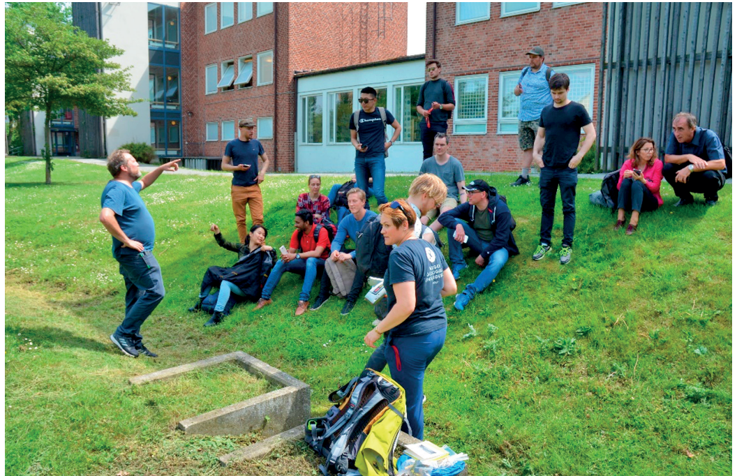
Figure 2. Interactie in een wadi met diverse participan- ten van climatecafe Malmö, Zweden (ref).

kunnen bijdragen aan participatie door rechtstreeks de effecten van klimaatverandering zichtbaar te maken in de wijk en mensen een plek te geven om van elkaar te leren. 11 Door gebruik te maken van kennisplatforms kan het thema waterbeheer breder worden getrokken en kan duidelijk worden gemaakt dat het gedrag van bewoners ook bij kan dragen aan een groenere en klimaatbestendige leefomgeving. Op deze manier kan participatie worden gestimuleerd.