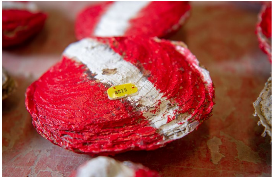
Met kleuren geven de onderzoekers de grootte en de schelpdichtheid van de oester aan. Aan het streepje is te zien of een oester op zijn bolle of platte kant ligt.

gen zodat de oesterlarfjes zich kunnen hechten. Biologische kennis is daarbij onmisbaar.’