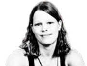
Tekst Tessa Louwerens

Wageningse en Delftse onderzoekers bestuderen in een mini-Noordzee hoe oesters reageren op stroming. Resource ging een dagje met ze mee.