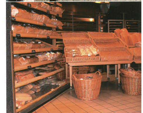
Willekeurige voorbeelden van een supermarkt, zoals men er zo vele in ons land aantreft.