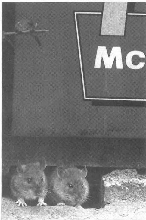
Ratten struinen met tientallen tegelijk de parkeerplaats af van de vestiging van McDonald's langs de A2 bij Rosmalen. Als alle rondslingerende verpakkingen zijn doorzocht, kijken ze daarna nog even of de afvalbakken wat lekkers bieden.

Door Fred Kramer ROSMALEN - Op de parkeerplaats van de McDonald's-vestiging langs de A2 bij Rosmalen liggen zakken met etenresten. Verderop in het gras zijn verpakkingen achtergelaten van cheeseburgers, Quarterpounders of Big Macs. Plotseling komt een zak in beweging, terwijl er geen wind is. Paradoes steken twee rattensnuiten naar buiten. Ze verdwijnen met een stukje hamburger in het hoge gras.