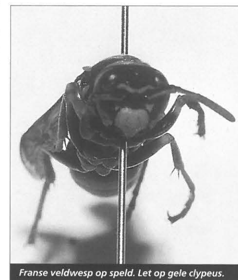
Franse veldwesp op speld. Let op gele clypeus.

Daar staat tegenover dat het in de meeste gevallen niet nodig is om veldwespen te bestrijden. Van de zoetigheid van bloemen en bladluizen maken ze een voorraad in het nest voor periodes van slecht weer. De larven van de veldwespen worden gevoerd met gevangen insecten zoals wantsen, snuitkevertjes en vlindertjes. De franse veldwesp heeft zich in de afgelopen 10 jaar sterk uitgebreid in Nederland. Het KAD-EVM verwacht dat we in de toekomst steeds meer veldwespen zullen tegenkomen. Omdat deze wespen nauwelijks overlast veroorzaken en een zeer nuttige functie uitoefenen (denk aan het bestuiven van bloemen en het wegvangen van insecten), is daarom een bestrijding in het algemeen niet nodig. Slechts in noodgevallen moeten ze verdelgd worden.