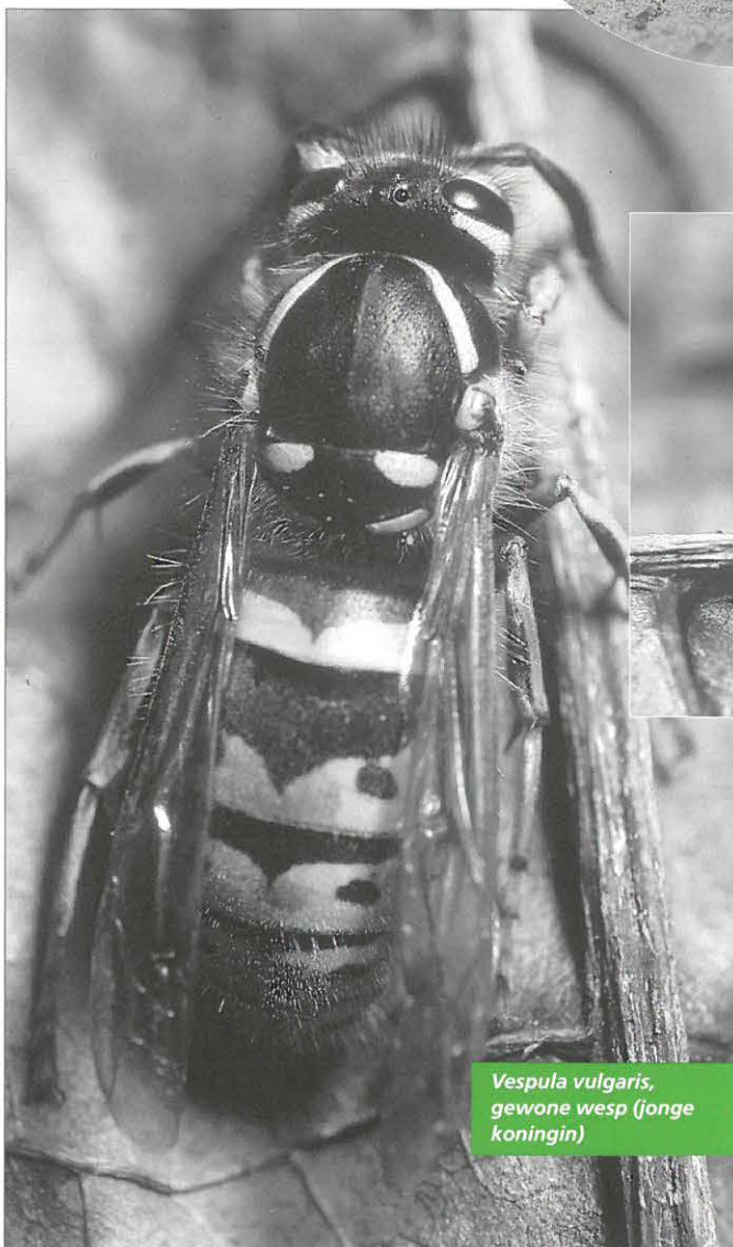
Vespa vulgaris , gewone wesp (jonge koningin)