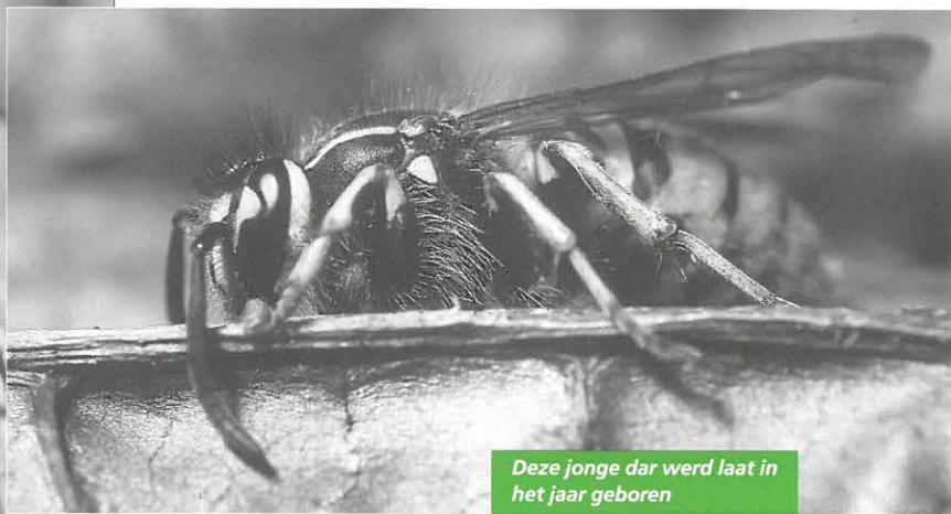
Deze jonge dar werd laat in het jaar geboren