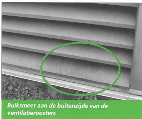
Buiksmear aan de buitenzijde van de ventilatieroosters

Tijdens de inspectie zag ik dat er diverse openingen rondom het pand zaten, sommige groot genoeg om een middelgrote hond door te laten. Maar op deze plaatsen vond ik geen sporen van de marter. In de verwarmingsruimte gekomen, viel mijn oog op diverse veertjes die bij de ventilatieroosters lagen. Normaal gesproken zijn deze roosters voorzien van gaas waar een vogel of marter echt niet doorheen komt.