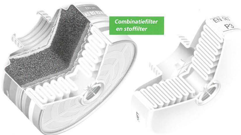
Combinatiefilter en stoffilter

In de nieuwe Arbo-informatie AI-31 van het Ministerie SZW wordt onder de noemer 'Gezondheidsrisico's van gevaarlijke stoffen' uitgebreid aandacht besteed aan persoonlijke bescherming. De meest actuele wet- en regelgeving is hierin meegenomen, net als de laatste stand van de techniek. U kunt de AI-31 opvragen van het Servicecentrum Uitgevers via (070) 378 98 80 of via e-mail sdu@sdu.nl .