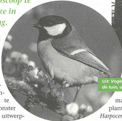
Uit: Vogels in en rond de tuin , uitg. Tirion

Toen het isolatiemateriaal bij het KAD onder de loep werd gelegd, werden in eerste instantie alleen enkele fragmenten van insecten gevonden. Niet iets om verwonderd over te zijn en te summier om conclusies uit te trekken. Een tweede monster volgde en hierin werden uitwerpselen gevonden. De vorm, kleur en substantie leken in de verste verte niet op die van knaagdieren of vleermuizen. Nee, de uitwerpselen bleken afkomstig te zijn van koolmezen die tussen het piepschuim een lekker hapje ontdekt hadden!