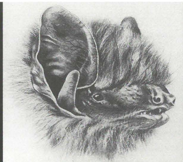
De gewone dwergvleermuis geeft jaarlijks in de zomermaanden aanleiding tot een aanzienlijke hoeveelheid klachten over overlast. Ill. Nat. Natuurhistorisch Museum, Leiden

Met uitzondering van holle bomen hebben vleermuizen in ons land geen natuurlijke verblijfplaatsen. Door het in toenemende mate vestigen van de mens is er een grote verscheidenheid aan kunstmatige verblijfplaatsen bij gekomen. Deze verblijfplaatsen waren oorspronkelijk niet voor vleermuizen bestemd, maar boden gaandeweg toch mogelijkheden voor vleermuizen om zich daarin te vestigen. Voorbeelden hiervan zijn zolders en spouwmuren