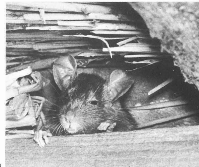
Waarnemingshouding zwarte rat in rieten dak