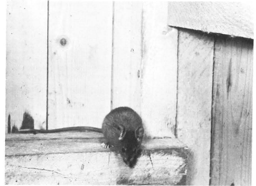
Zwarte ratten in waarnemingshouding (Foto's Milieu-Hygiëne)

Bij het sterkste roedel in deze experimenten (210 dieren) werden in een dergelijke situatie 2 van de 6 vreemden verdreven. Beide mannetjes waren nl. tot vlak bij enkele nesten doorgedrongen en maakten aanstalten er binnen te gaan. De andere 4 bezetten steeds lege nesten, die in grote territoria altijd aanwezig zijn. De vreemden hadden zich na 3—5 dagen volledig aan de nieuwe situatie aangepast.