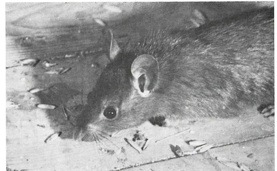
Zwarte voorpost

Toen ik jong was ging ik in Artis wel eens mee op de rattenvangst met mijn oude vriend D. van den Burg, toen de pachter van Artis' café-restaurantbedrijf. Hij was een later bij riolen als de grotere bruine rat, die de stadsbewoners beter dan de zwarte soort-