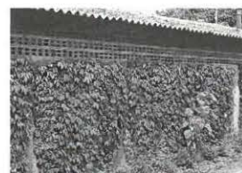
Groenvoorziening langs schuren

Bij een geslaagde bestrijding horen ook weringsmaatregelen. Om die reden zijn de gaten en kieren aan de buitenkant van de varkenshal dichtgemaakt, is de groenvoorziening langs de schuren weggehaald en zijn de openingen onder de golfplaten daken voorzien van roosters.