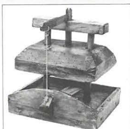
Blokval waarbij de stelpal door een touwtje aan een hefboom vastzit