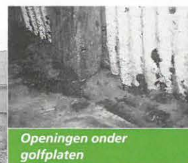
Openingen onder golfplaten