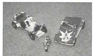
Speelgoed vervaardigd van oude spuitbussen met bestrijdingsmiddelen

Inmiddels heeft de heer van Veldhuijzen opnieuw uitbreidingsplannen. Naar verwachting zal er voor het einde van het jaar 2000 een nieuw expositiegedeelte in gebruik zijn, waar twee thematentoonstellingen worden ingericht: "Vlinders" en "De pest". Waarschijnlijk zal ook boven de ingang van die ruimte een afbeelding van een spin hangen. Een spin boven de deur trekt volgens oud bijgeloof immers klanten... ■