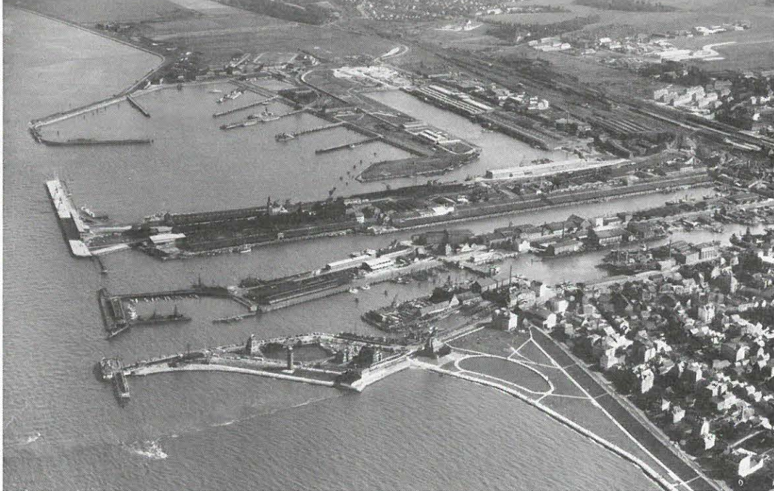
Luchtfoto van het havengebied van Cuxhaven