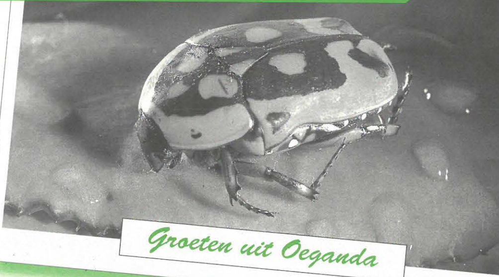
Groeten uit Oeganda